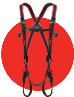
FUJI 4015 Sturzgeschirr 3D Art.-Nr. 8.84.015.00