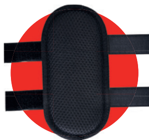
MOROTO 4184 Abnehmbares Schulterpolster Art.-Nr. 8.84.184.00